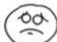
KOJI SE PRAVDA